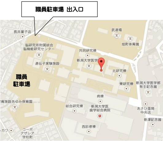
所在地：新潟県新潟市中央区旭町通一番町 757 番地 (新潟大学旭町キャンパス内)