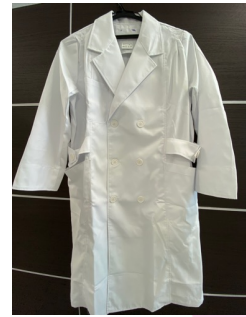
マタニティ白衣 八分袖 日昇産業株式会社